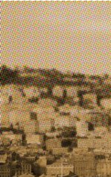
Panorama dal mare, Genova

Symposia è certificata ISO 9001 per la progettazione ed erogazione, nell'ambito dell'Educazione Continua in Medicina (ECM), di eventi formativi residenziali rivolti a tutte le categorie di professionisti della Sanità.