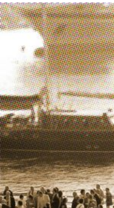
SIGO 2004, welcome cocktail

Gruppo di Lavoro Uroginecologia Pavimento Pelvico Società Italiana di Andrologia Società Italiana di Urologia Oncologica Società degli Urologi del Nord Italia